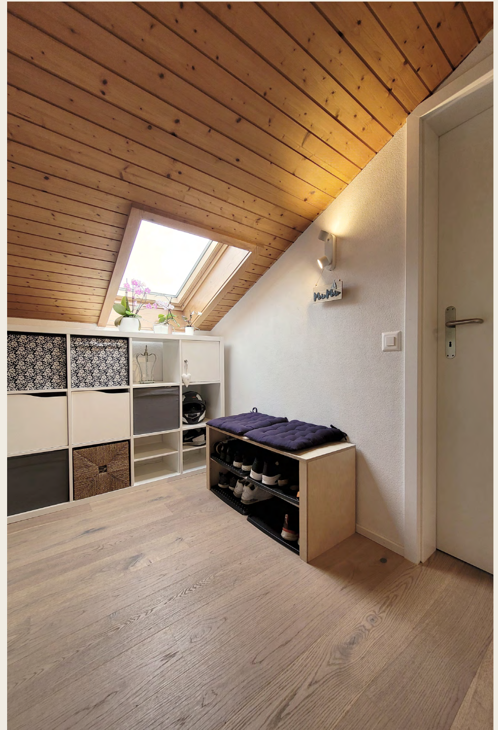
Wohnung OG: Wohnen, Küche, Entrée