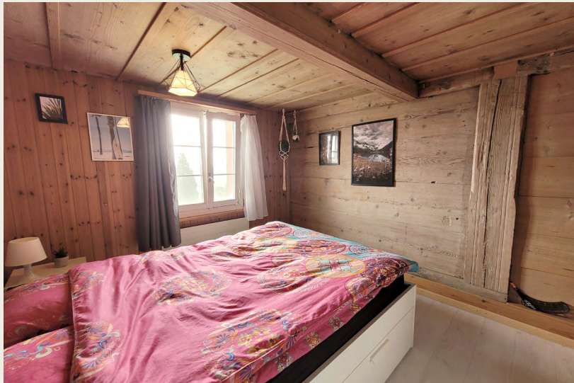
Wohnung EG: Küche, Zimmer, Wohnen