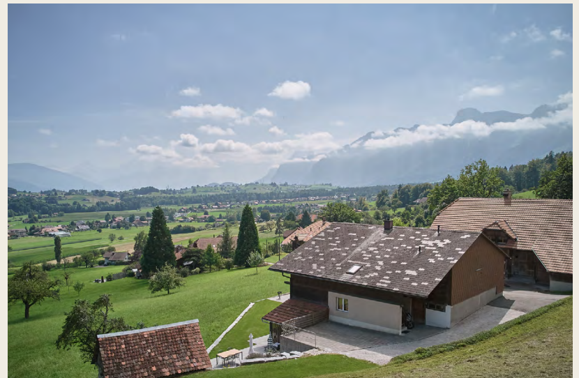
Aussenansichten mit Umgebung