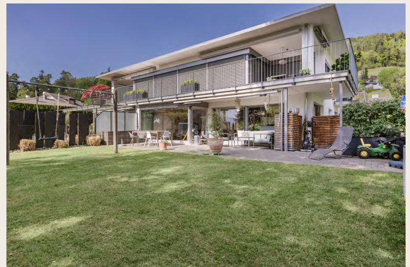
Aussenansichten mit Umgebung / Garten