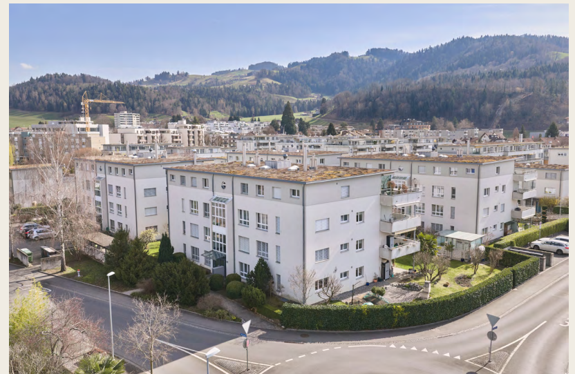
Aussenansichten mit Umgebung / Quartierimpression