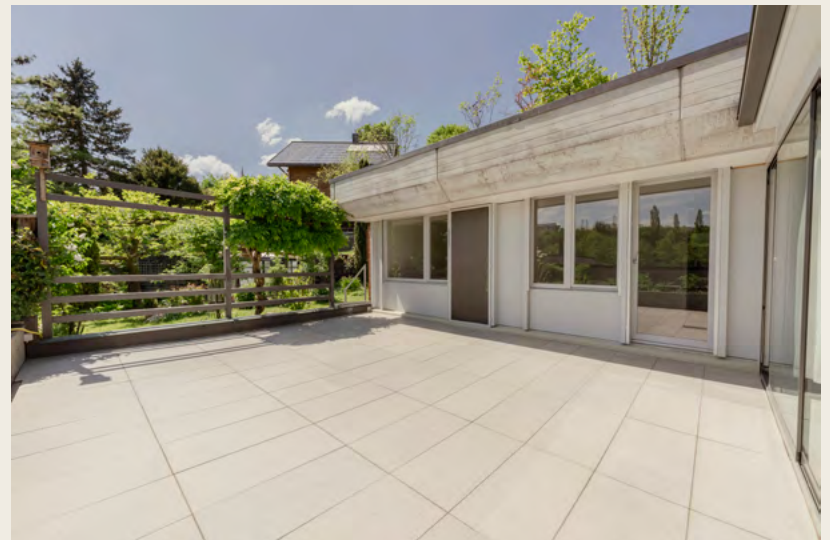
Aussenansichten mit Umgebungsimpressionen